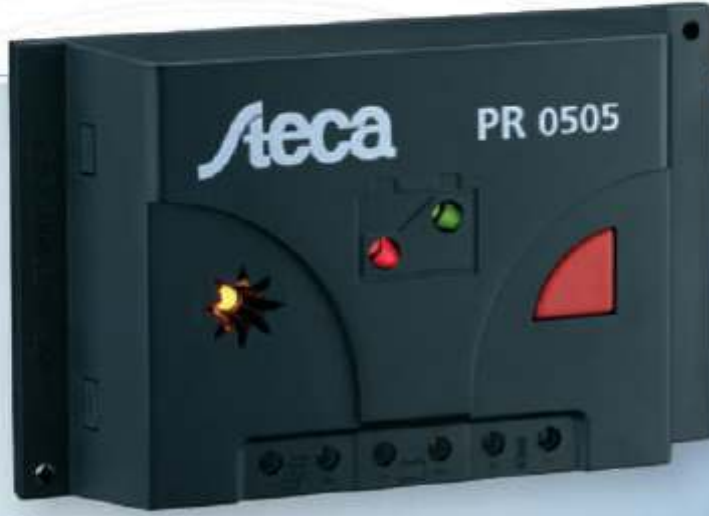
Steca PR PR 0303, PR0505