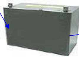
Battery ( Akü )