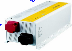
Inverter ( İntertör )